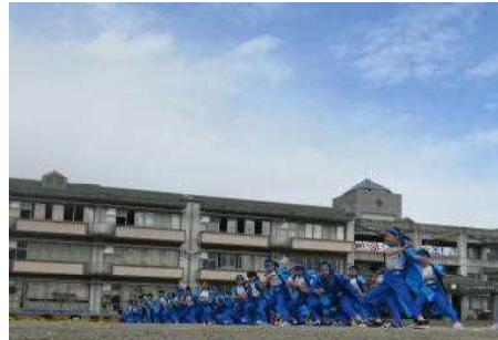
〈6年生〉 響け！魂の五小ソーラン2023