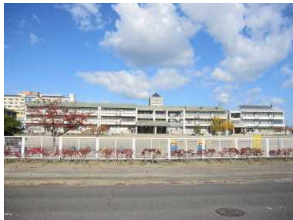
現在の五小校舎(R3.10.28撮影)