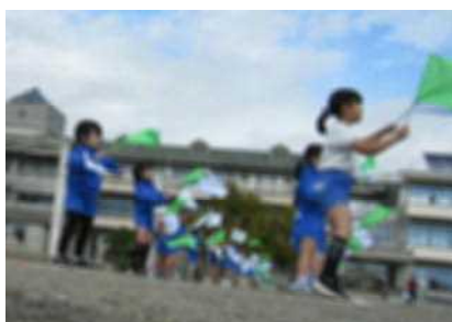
〈2年生〉 ここがみんなの ダンスステージ！