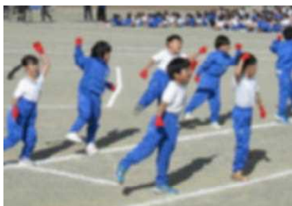
〈1年生〉 元気ハツラツ！ ダンスカーニバル！