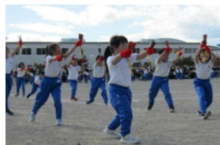
〈3年生〉 よっておいで、 みておいで風の子の花唄