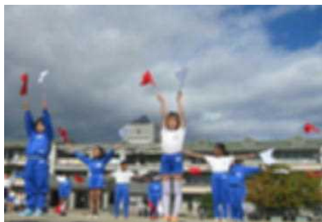
〈4年生〉 団結！～思いを1つに～