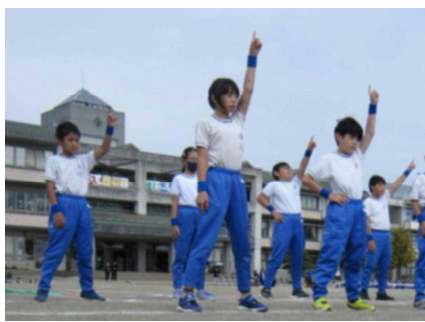
〈5年生〉 一致団結～足をそろえ 心を合わせワンツーワンツー！～