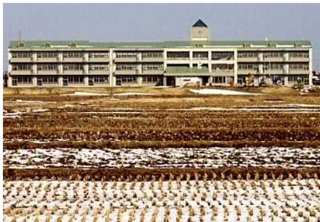
開校直前の五小校舎(H8冬撮影)

名札や体操着などに付いている校章は、あやめをデザインしたものです。五小ができた時は、大崎市ではなく、古川市でした。その古川市の花があやめでした。この校章の三方に広がる花びらは「信頼」「勇気」「希望」を表しています。